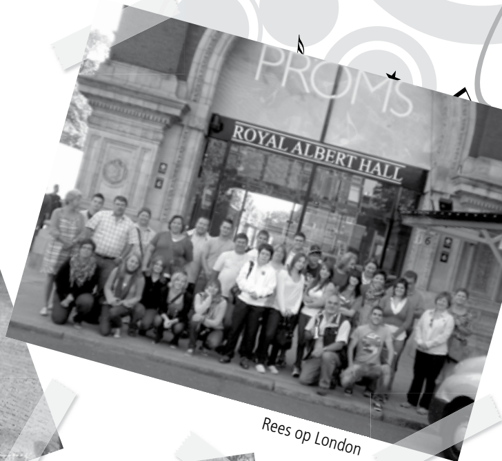
Rees op London