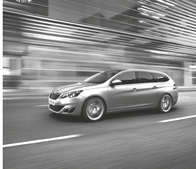
NOUVELLE PEUGEOT 308 SW

TESTEZ LES NOUVELLES 308 ET 308 SW, ÉLUES VOITURES DE L'ANNÉE.