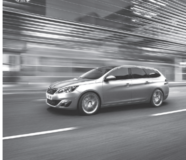
NOUVELLE PEUGEOT 308 SW

TESTEZ LES NOUVELLES 308 ET 308 SW, ÉLUES VOITURES DE L'ANNÉE.