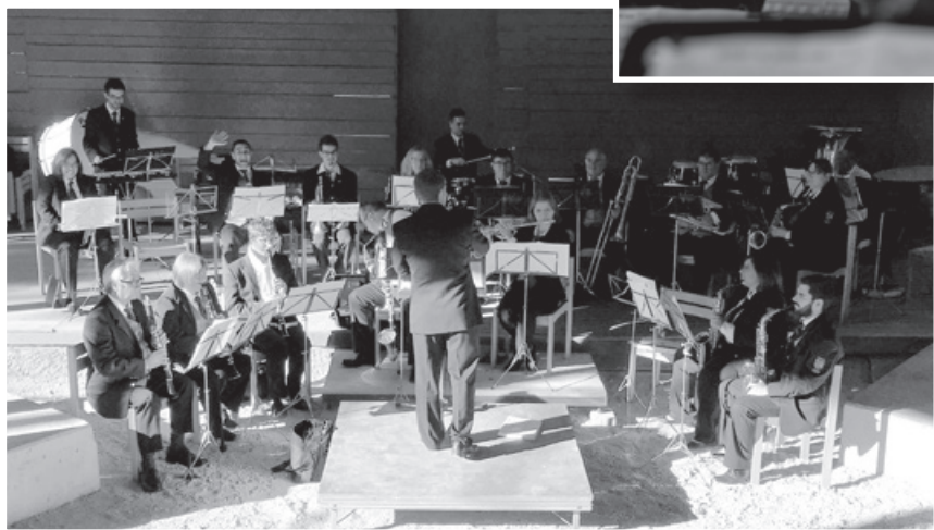
Concert am Réimertheater zu Duelem