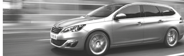
NOUVELLE PEUGEOT 308 SW

TESTEZ LES NOUVELLES 308 ET 308 SW, ÉLUES VOITURES DE L'ANNÉE.